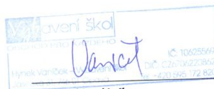
za prodávajícího Hynek Vaníček